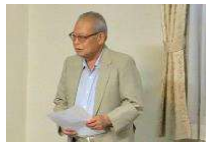
柳下理事長より挨拶

当地区における、より魅力的なまちづくりの検討を、本年も引き続き皆さまと結束して邁進していく所存です。何卒よろしくお願い申し上げます。