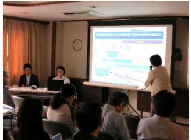
▲6/29 第14回説明会当日の様子

事業計画図面として作成した図面から、現在までの設計検討による改善点をはじめとする施設計画(案)の検討状況の報告と、皆様の従前従後の資産(案)についての考え方や基準等について、専門コンサルタントより説明いたしました。